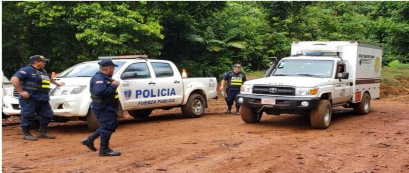
La Policía desplegó un operativo en la zona en busca de evidencias, luego del crimen de cuatro personas.

Un nicaragüense de apellido Pérez figura como el sospechoso de asesinar al padre y hermano de la niña a la que violó y embarazó.